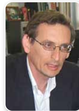
ח"כ דב חנין סיעת חד"ש