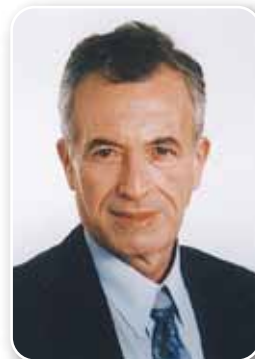
ח"כ גדעון עזרא סיעת קדימה