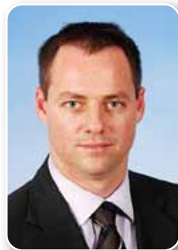
ח"כ יוחנן פלסנר סיעת קדימה