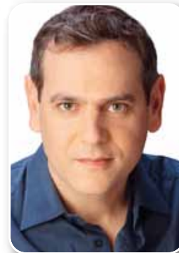
ח"כ ניצן הורוביץ סיעת מר"צ