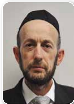
ח"כ אורי מקלב סיעת יהדות התורה